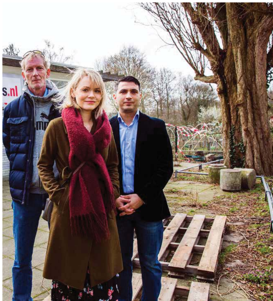
Oduncu van Stichting Schets voor het gebouw waar het buurthuis komt.

Schets is zo'n project, weet coördinator Keus. "Dit is wat de politiek wil: kleinschalige initiatieven vanuit de bewoners zelf."